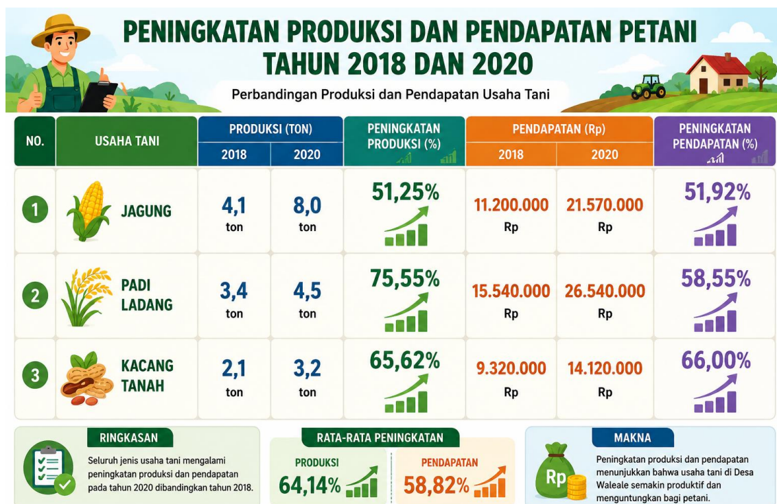
Gambar 4 Peningkatan Produksi dan Pendapatan Petani Tahun 2018 dan Tahun 2020

Pembangunan pertanian dilaksanakan melalui penguatan manajemen mulai perencanaan sampai pasca panen. Pada tahun 2020 dilaksanakan identifikasi dan Focus Group Discasion (FGD) kepada petani dan tokoh masyarakat Desa Waleale untuk mengetahui perkembangan luas lahan usaha tani, perkembangan produksi usaha tani, dan perkembangan pendapatan petani Desa Waleale. Hasil analisis peningkatan produksi dan pendapatan petani Desa Waleale terlihat pada gambar 4 berikut ini: